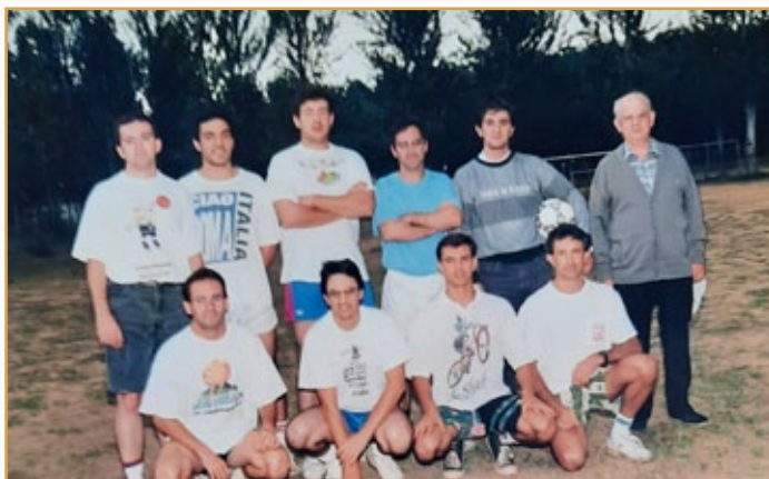
Grupo de Hermanos durante un curso de formación en Valladolid

En este año 1991 marcha de nuevo a Cataluña, donde pasará seis años en Barcelona-Horta, los dos primeros como Superior de la Comunidad, de aquí pasará a Gavà en 1997 y en el año 2000, ya relevado de tareas docentes, vuelve a Barcelona. Toda su vida se dedicó a la docencia, fundamentalmente de las matemáticas y la física.