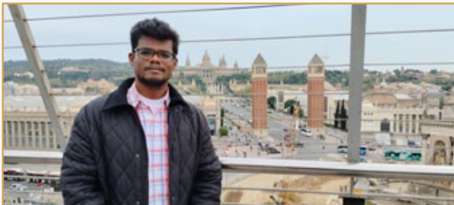
H. Sunil. Vista panorámica de la Plaza de España y del Palácio de Monjuïc de Barcelona.

En una visita a las comunidades de España, un Hermano me preguntó: ¿cuál es el motivo por el que cada año vienen a Roma y a España Hermanos de la India? ¿Serán los Hermanos de la India quienes gestionen en un futuro próximo las comunidades y centros de España?, no lo dude, contesté. Son los hermanos pequeños que no tenemos en nuestras comunidades