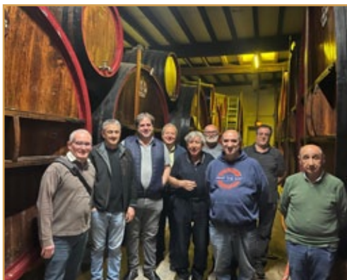
Visita a la destilería Sainte Famille