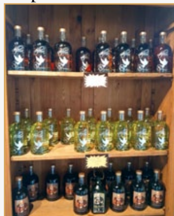
Stellina, Kario y Kilon