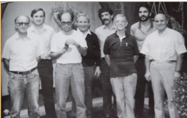
Reunión de Hermanos en Ecuador, en 1991

Somos hijos del pasado... ¡y cuántas cosas se hicieron bien! Basta abrir los ojos para reconocer la importancia misionera vivida en esos momentos. Es justo dar gracias por aquellos Hermanos que, en su día, entregaron alma, vida y corazón a la misión, al trabajo cotidiano y a la gestión de nuestras obras. Su tesón y generosidad consolidaron lo que hoy somos. Lo suyo no fue “flor de un día”, sino siembra de futuro. Que no lo olvidemos, ni los que lo vivieron en primera persona, ni los que hoy recogemos ese legado y seguimos sembrando.