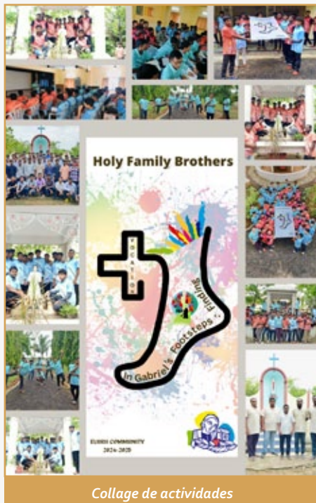
Collage de actividades

Los tiempos fuertes de "Adviento y Navidad" trajeron calidez y alegría a nuestra casa, mientras los novicios, postulantes y aspirantes se reunieron para oraciones, compañerismo y celebración. La festividad de la "Sagrada Familia" el último domingo de enero fue otro punto culminante, uniendo a todos Hermanos en reflexión sobre las virtudes de Nazaret. Un día de retiro profundizó aún más nuestra comprensión de la espiritualidad familiar en la vida religiosa.