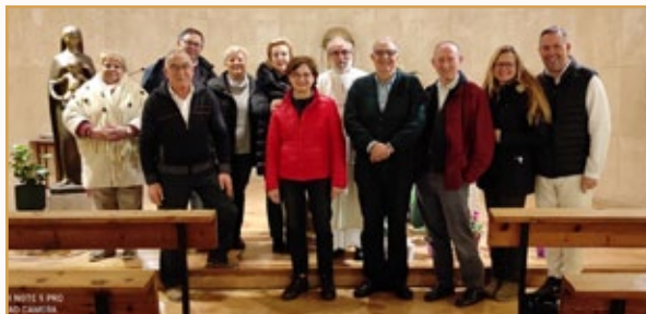
Comunidad de Hermanos y Fraternidad de Palma

Toda la comunidad participa en las reuniones de la Fraternidad Nazarena y hemos compartido con ellos los días de reflexión de Adviento y Cuaresma. Este año, además hemos acogido el encuentro de Animadores de Fraternidades, acompañándolos en la oración, visitando algún rincón de la Isla (Sóller y su puerto) y compartiendo la gastronomía local.