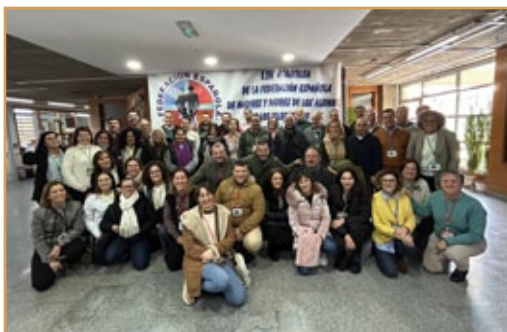
Asamblea FEAMPA. Madrid, 15 y 16 de marzo de 2025.