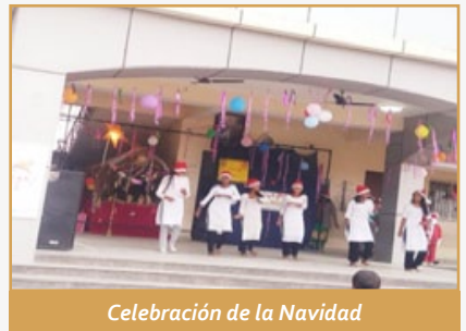
Celebración de la Navidad