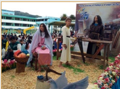
Carroza con la Sagrada Familia viviente, en el patio del Colegio Verbo Divino de Guaranda (Ecuador)