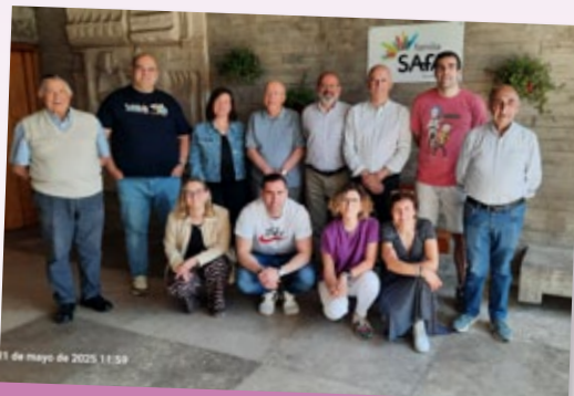
Formación de formadores en Valladolid, tercer encuentro