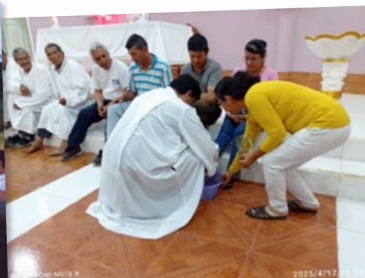
Misiones en Ecuador