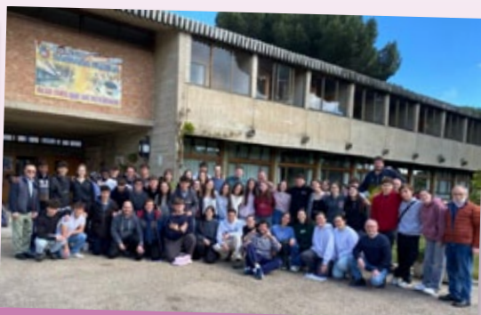
Pascua para catecúmenos de confirmación en Valladolid