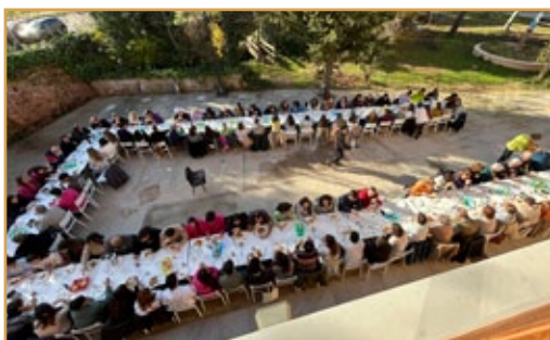
Encuentro Familia Sa-Fa. Sigüenza, 30 de noviembre y 1 de diciembre de 2024.