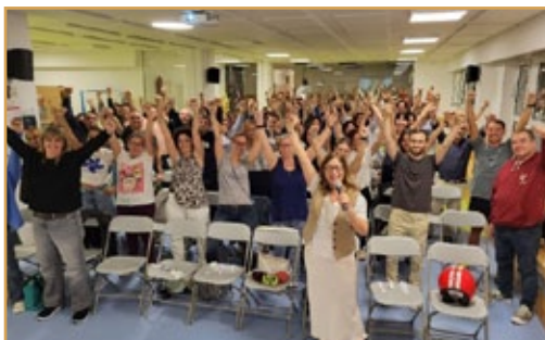
Sesión de formación de los Profesores del Claustro de Horta