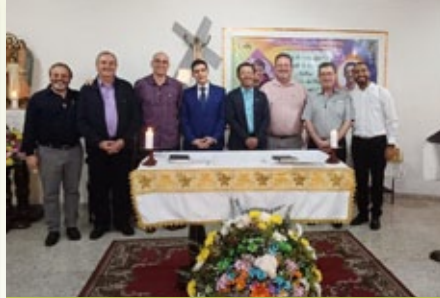
Grupo de Hermanos en la profesión de Bucaramanga