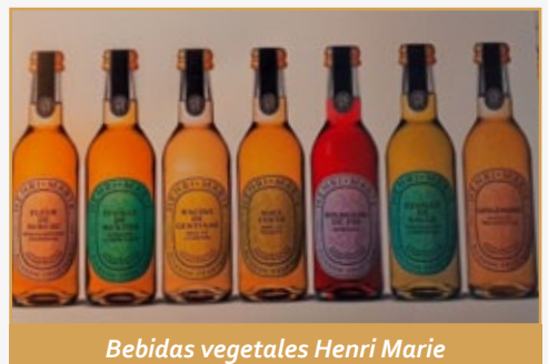
Bebidas vegetales Henri Marie