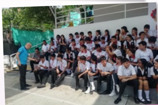
Animación vocacional en Bucaramanga (Colombia)