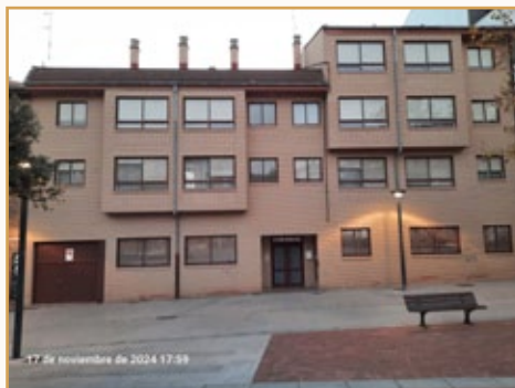
Casa de la calle Villalón, 35, de Burgos