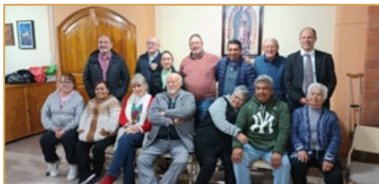
Visita del H. Provincial