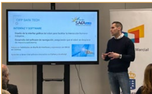
Presentación Proyecto HIGÍA. Valladolid, 6 de febrero de 2025.