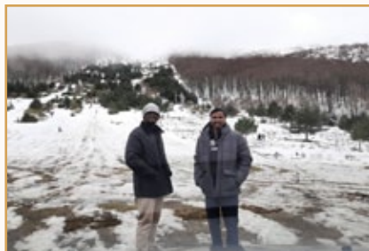
Una tarde en la nieve, en Burgos

Me llevo muy bien con los Hermanos españoles, generalmente es un trato familiar, agradable y sin discriminaciones de ningún tipo. Yo les trato como a "hermanos en Cristo", como familia y en todas las comunidades me he sentido acogido y querido. Entre ellos se conocen mucho, son mayores y saben aceptar a todos para salvar la comunidad. La presencia en la comunidades un valor que crea lazos y fortalece a cada hermano.