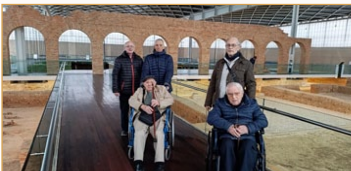
Villa romana de La Olmeda

Con la imposición de la ceniza a los Hermanos y alumnos comenzamos la Cuaresma: tiempo de oración y penitencia.