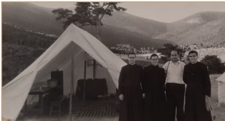
Campamento de Magisterio, años '50

Comenzó su actividad docente y educativa en septiembre del año 1951, en el colegio Sagrada Familia de la calle O'Donnell, en Madrid, dando clase a los más pequeños, donde estuvo hasta 1959. En estos años obtuvo la titulación de Maestro Nacional. En el año 1954, el día de la Solemnidad de Santiago Apóstol, pronunció sus votos perpetuos, en La Aguilera.