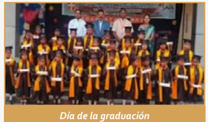
Día de la graduación