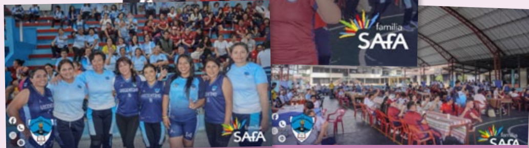
Jornada de Integración Sa-Fa en Puyo (Ecuador)