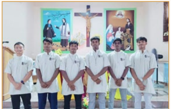
Novicios de Eluru

I still hear the cheerful noise of students in our schools, filling the classrooms and courtyards with life. But I also hear other, quieter voices — just as important: the voice of the Brother who rises early each morning (or even earlier, depending on the place) to be on time for prayer; the voice of the Brother who, full of hope, asks how to make community life more fraternal; the voice of the sick Brother who, from his bed, offers his pain and continues to be a silent apostle.