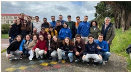
Comunidades jóvenes de Madrid, en la Pascua

El Carnaval estuvo muy trabajado por los profesores y hermanos en la realización de los disfraces y el posterior desfile por el pueblo.