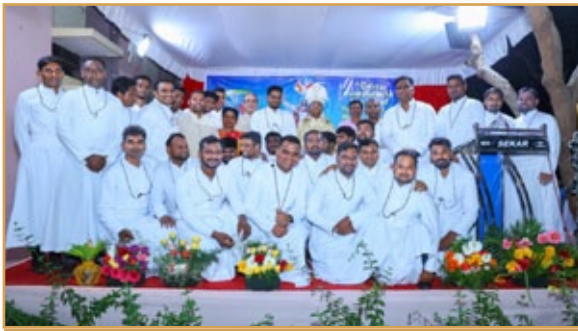
Grupo de Hermanos que asistieron a la Profesión Perpetua en Madurai

If the present invites us to give thanks, the future calls us to trust.