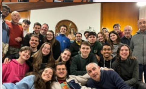
Encuentros vocacionales en Ambato (Ecuador) y en Sigüenza