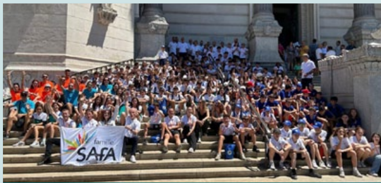
Alumnos, españoles, franceses e italianos, participantes en la X Olimpiada Sa-Fa