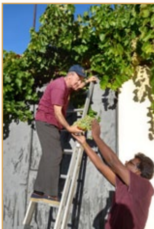
De vendimias en La Horra

También, a lo largo del año, las diversas Asociaciones del pueblo de La Horra: Santa Eulalia, Galán Horrense, El Cogollo, familias numerosas, barrios, celebraciones de cumpleaños, piden nuestro comedor para celebrar comidas o cenas, pues el Salón cultural del pueblo resulta pequeño o no siempre está disponible.