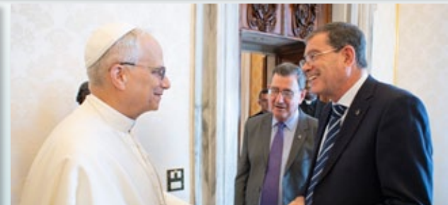
Nuestros Superiores saludan al Papa León XIV