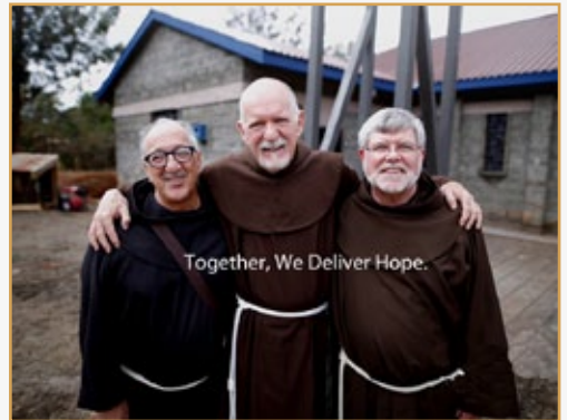
Juntos, regalamos esperanza

Y vendrán tormentas y habrá que resituar cosas y sobre todo perdonar por que es mi hermano y mi familia. Y quizá pase, como dice el Papa, que no tengamos que olvidar pero sí renunciar a la espiral de la violencia y negatividades y construir y mostrar al mundo que es posible vivir diferentes pero juntos. Y no será mi amigo, pero es mi hermano, mi familia.