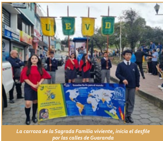
La carroza de la Sagrada Familia viviente, inicia el desfile por las calles de Guaranda

Crónica tomada de las NOTICIAS de la página web del Instituto