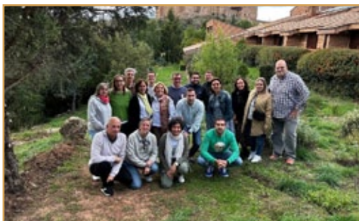
Encuentro Liderazgo Familia Sa-Fa. Sigüenza, 27 y 28 de septiembre de 2024