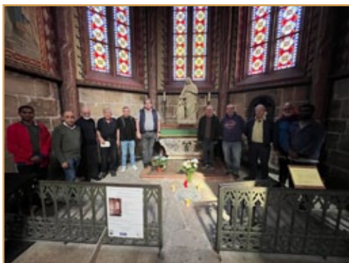
Peregrinos en la tumba del V. H. Gabriel, en la catedral de Belley