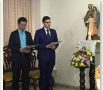
Primera Profesión en Bucaramanga (Colombia)