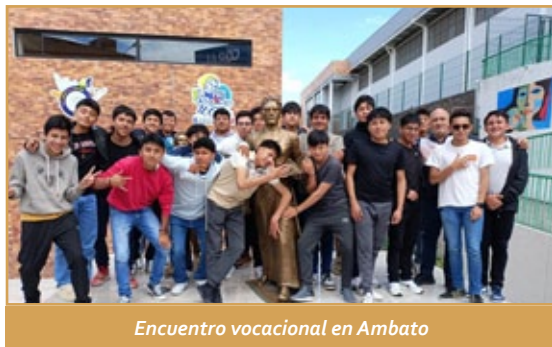
Encuentro vocacional en Ambato

Nuestra institución y nuestra comunidad nos sentimos muy unidos a la Iglesia local. En nuestras instalaciones se han celebrado eventos importantes como el encuentro de todos los