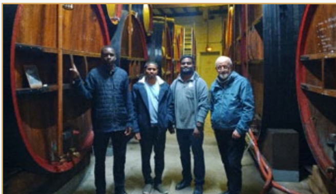
Hermanos de la casa Gabriel Taborin visitando la destilería