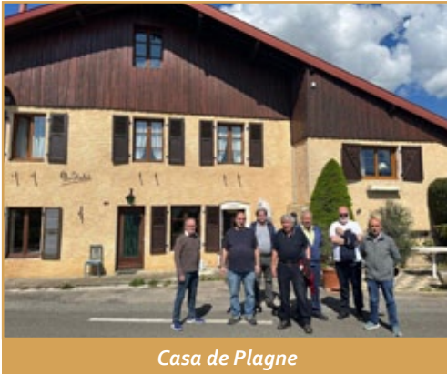
Casa de Plagne