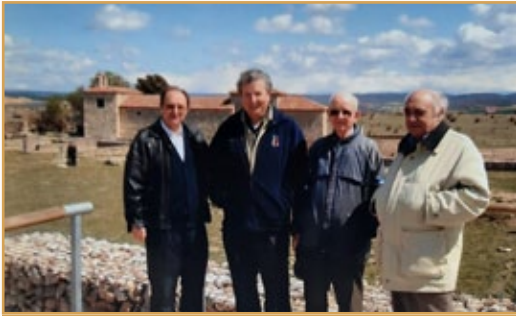
Hermanos de la Comunidad de Burgos en la Ciudad romana de Clunia