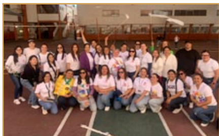
Equipo de catequistas