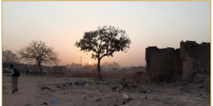
Salida del sol en "la brousse", camino de Yagma