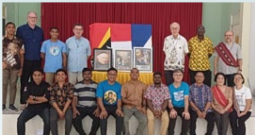
Miembros del Capítulo de la Vice-Provincia San José Obrero