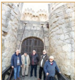
Castillo de Ampudia

En el mes de marzo , aprovechando el puente de carnaval, la comunidad tuvo una excursión de un día para visitar algunos pueblos de la cercana provincia de Palencia: Villalcázar de Sirga, Carrión de los Condes, la Villa de La Olmeda, cercana a Saldaña o Ampudia. Fue un día de relax y convivencia comunitaria.