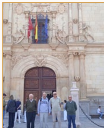
Ante la puerta de la universidad de Alcalá

El 2 de febrero , día de la Vida Consagrada, día de la Candelas, lo celebramos con un tiempo de oración y celebración en el Monasterio Ntra. Sra. de los Huertos, de las Hermanas clarisas de Sigüenza.