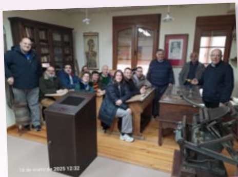
Formación de Formadores en La Horra, segundo Encuentro