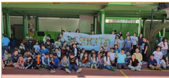
Celebración de la Pascua con los niños en Tijuana