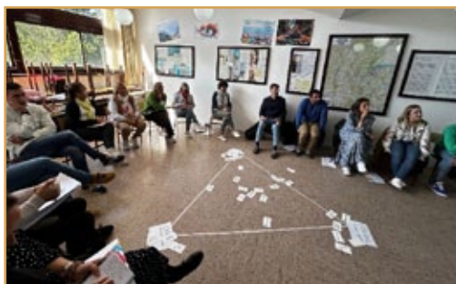
Encuentro de profesores de reciente contratación. Sigüenza, 15 y 16 de noviembre de 2024.