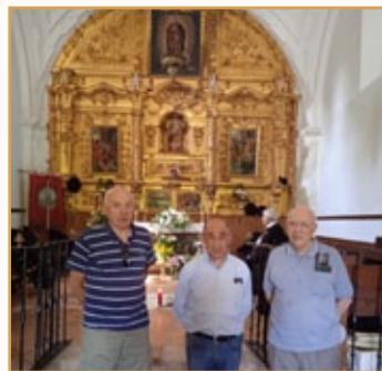
Ermita de la Virgen de la Estrella en Atienza