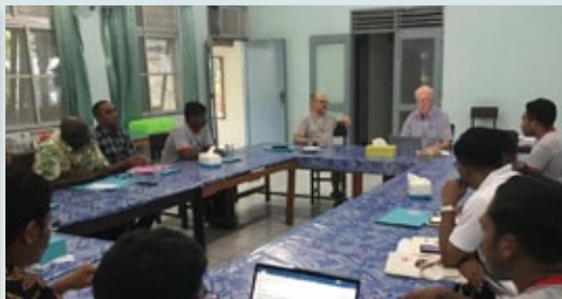
Sesión de trabajo en el Capítulo de la Vice-provincia de San José obrero