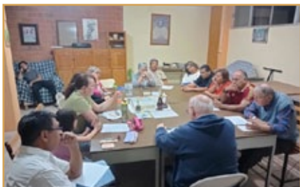
Retiro con la Fraternidad

EJERCICIOS ESPIRITUALES con nuestra Fraternidad Nazarena. Los hemos realizado en el primer fin de semana de septiembre (viernes, sábado y domingo) con temas formativos por parte de los Hermanos y con la convivencia fraterna en la que todos(as) participaban en los trabajos y los diferentes servicios, en un buen clima de acogida y de fraternidad.