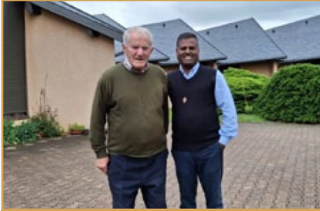
Visita a la casa de los Hermanos de Belley

y nuestra Casa Madre en Belley, lugares sagrados que aún renuevan la fe y la visión de nuestros antepasados espirituales. También tuve el privilegio de visitar Belmont y Champdor, rastreando las raíces de nuestro carisma. Uno de los momentos más emotivos fue mi visita al santuario de San Juan María Vianney, santo Cura de Ars. Su humilde e incansable dedicación a su misión sacerdotal me inspiró en mi propio camino de servicio.