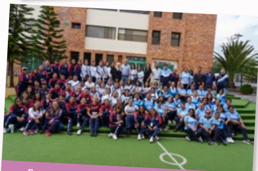
Encuentro de Formación de Educadores Sa-Fa de Ecuador, en Ambato