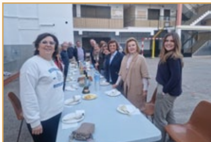
Encuentro de Animadores de Fraternidades

Para reforzar la vida de comunidad hicimos una pequeña excursión por la isla, visitando el Puig de Sant Salvador y algunas localidades cercanas.