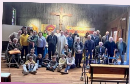
Hermanos mayores y familias, celebran la Pascua en Valladolid