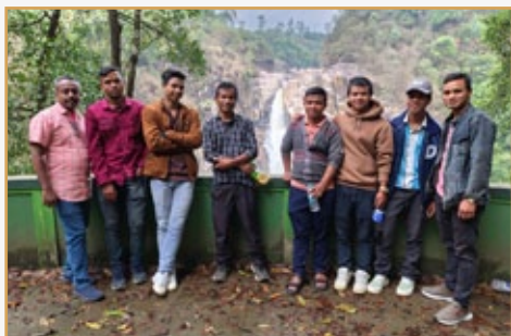
Fraternidad Nazarena, mayo 2025

experiencia inolvidable para él y esperamos que en el futuro más personas como él vengan a compartir la experiencia de misión en esta fundación. Agradecemos el apoyo que la familia carismática que nos brinda en la distancia por medio de las comunicaciones y las pequeñas, pero necesarias ayudas económicas.