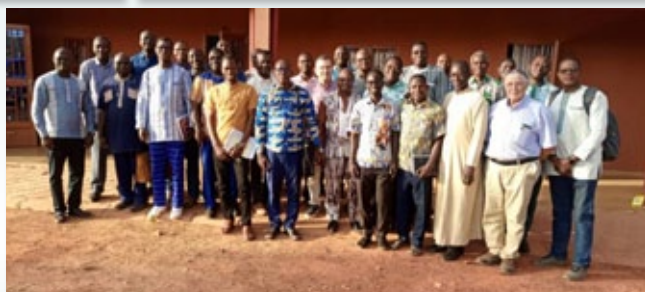
Jornadas de Formación en Koudougou (Burkina Faso)