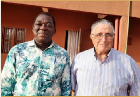
Con el H. Sylvestre en Koudougou