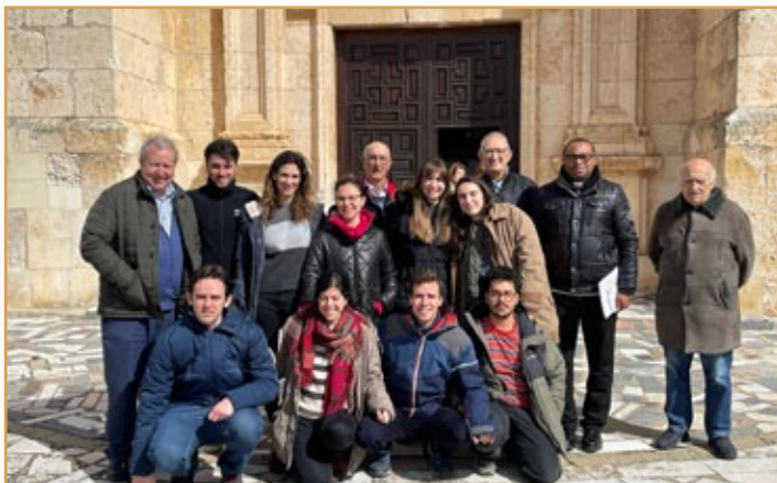
Retiro de la comunidad juvenil de 4.º de Carrera de Madrid, con los Hermanos de La Horra

Durante todo el año, el "grupo de memoria" de mayores, tiene clase un día a la semana en nuestro salón. A diario se tiene la Santa Misa en la Capilla de la casa, a la que también asisten personas del pueblo; excepto Domingos, fiestas de Precepto, funerales ..., que se celebran en la iglesia parroquial.