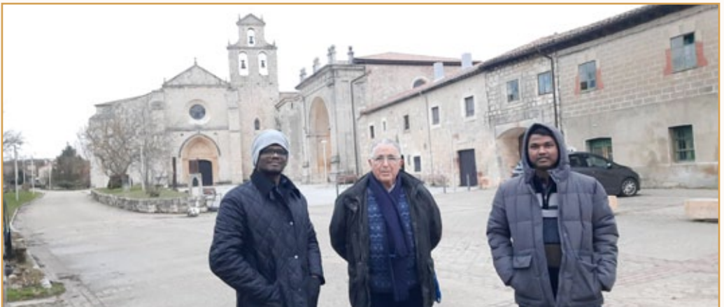
Paseo a San Juan de Ortega - Camino de Santiago