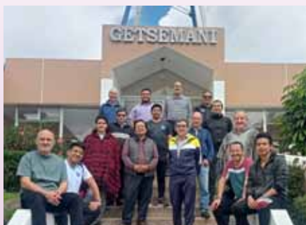
Ejercicios espirituales en Quito, Casa Getsemaní (Ecuador)