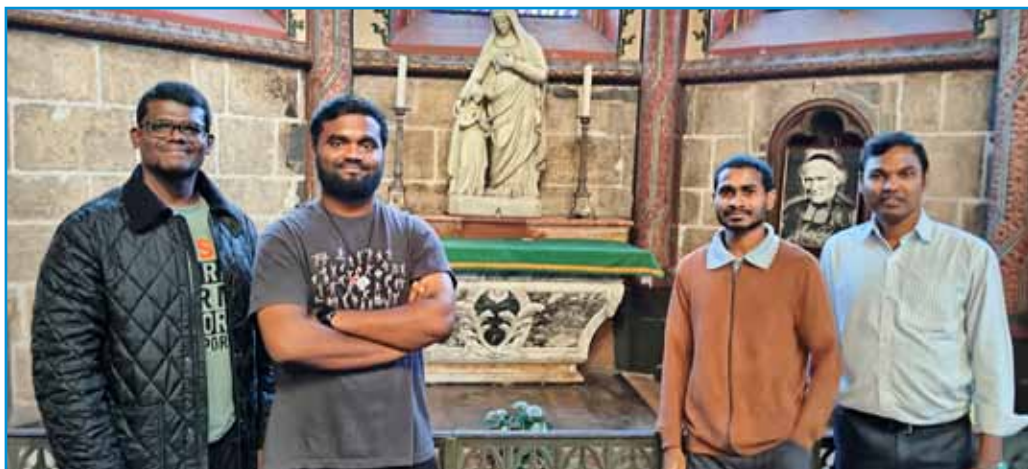
Los cuatro Hermanos de la India ante la tumba del V.H. Gabriel, en la catedral de Belley