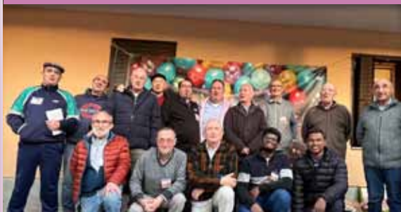
Hermanos que participaron en el Encuentro de la Familia Sa-Fa en Sigüenza