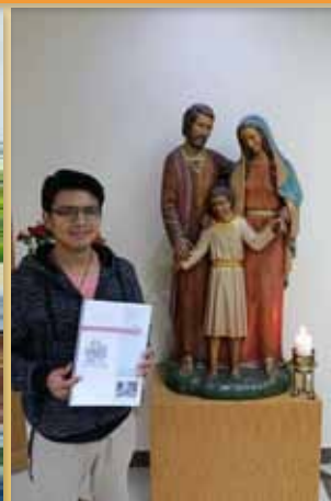
Entrada al Noviciado en Quito (Ecuador)