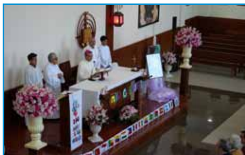
Eucaristía presidida por el Obispo de Guaranda

Tras la sesión solemne se realizó la inauguración del grupo escultórico en bronce: "El H. Gabriel en salida". Las esculturas