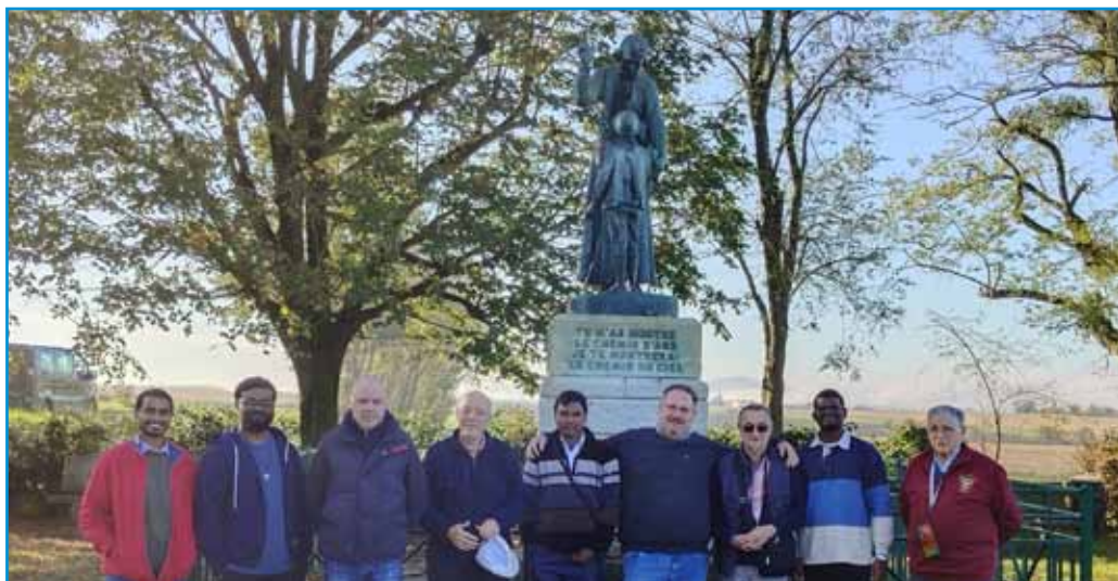
Grupo de peregrinos en Ars, al pie del Monumento del Encuentro