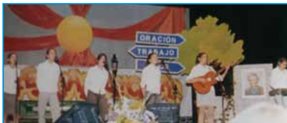
Escenario de la canción vocacional