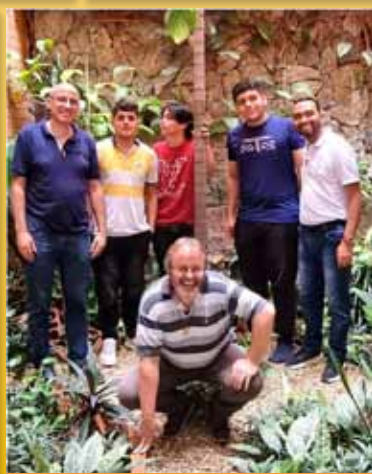
Promoción vocacional en Bucaramanga