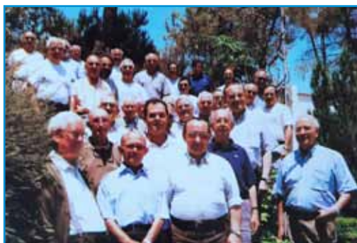
Ejercicios E. en Begues (Barcelona)