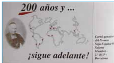
Cartel Premio SaFa España '99