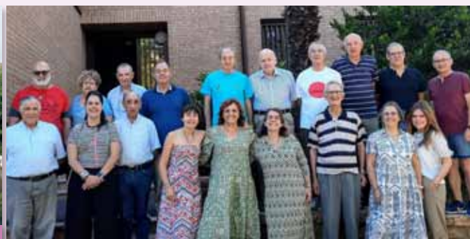
Ejercicios espirituales en Sigüenza