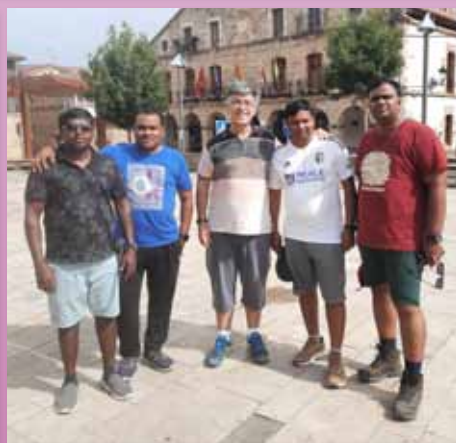
Hermanos de la India visitan Polientes, una de las primeras escuelas fundadas en España