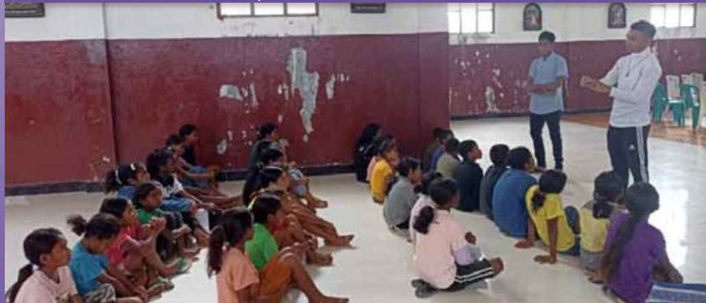
Niños de Ponilala en catequesis