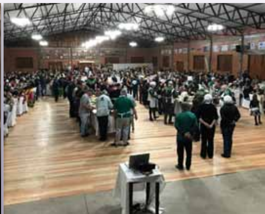
6o aniversário en Marau - Cena comemorativa