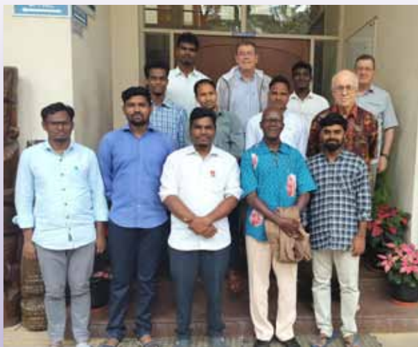
El Consejo General con los HH. del CRI Bangalore