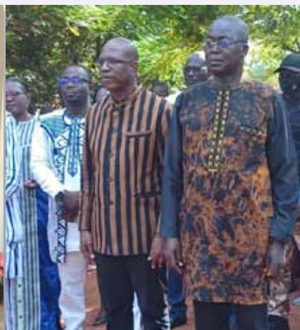
El ministro de Educación de Burkina inaugura el nuevo curso en el Colegio Gabriel Taborin