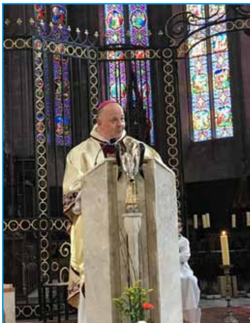
El Obispo de Saint-Claude en la homilía

alumnos, y luego hizo alusión a los 400 Hermanos que en la actualidad forman parte de la Congregación y que están repartidos por todo el mundo y atienden en sus centros a cerca de 40.000 alumnos.