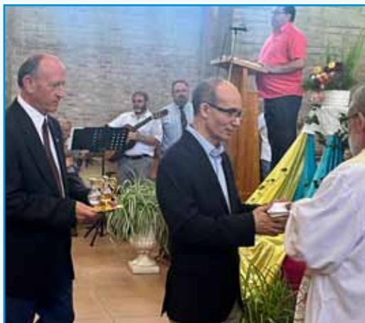
Presentación de las ofrendas de pan y vino