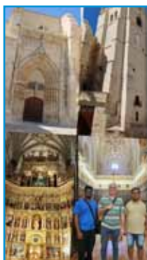
En la catedral de Palencia

ciones, en los aspectos de Vida Religiosa, Vocaciones y Formación, Pastoral, Educación y Economía, seguidos de los cuales hubo unos interesantes debates.