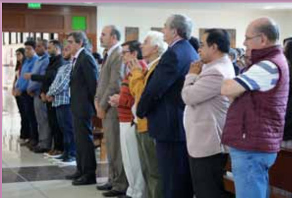
Hermanos de Ecuador en la misa de inauguración de la estatua del H. Gabriel