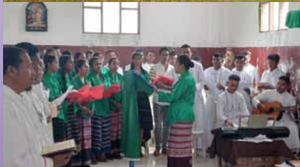
Ponilala, nueva casa de misión en Timor Oriental