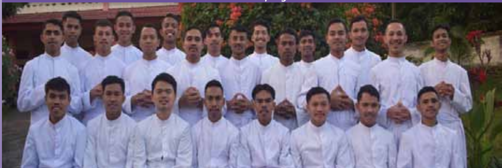
Novícios en Nita (Indonesia)