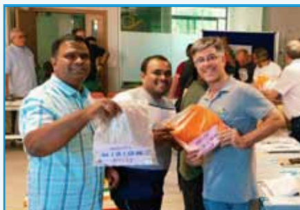
Entrega de camisetas