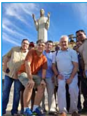
En el Cristo del Otero en Palencia