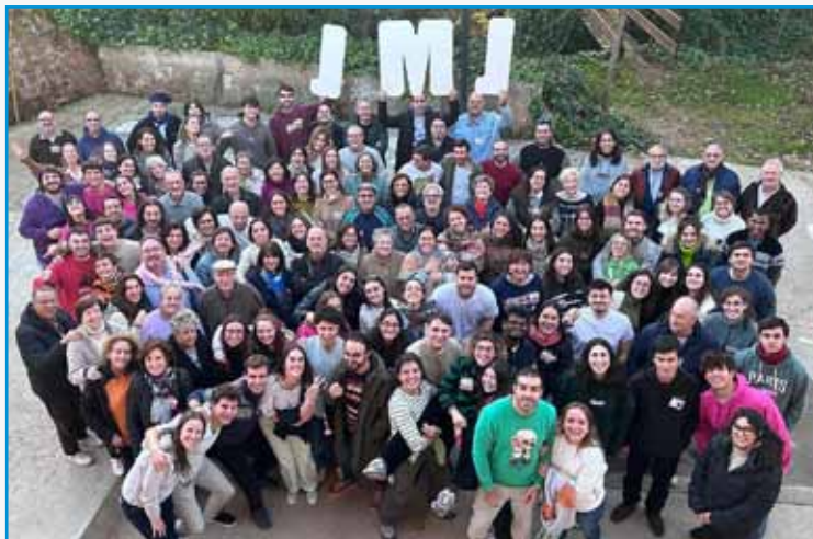
Encuentro nacional de la Familia Sa-Fa en Sigüenza, el 29 y 30 de noviembre