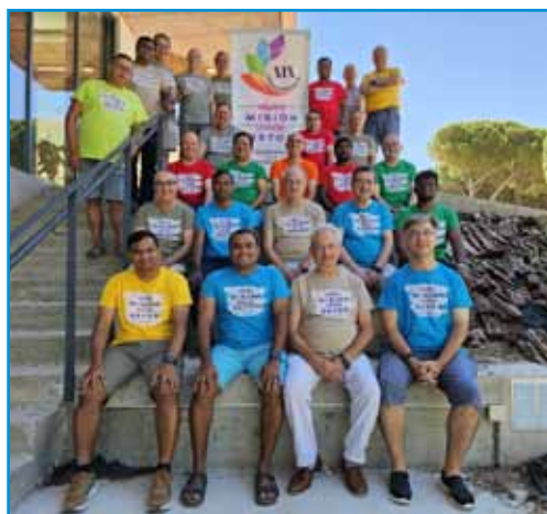
Hermanos participantes en el XIX Capítulo Provincial