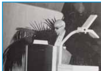
El H. Teodoro, Superior General, inaugurando el Congreso

El lunes, 24, después de una mañana para visitar libremente Lyon, el Colegio Charles de Foucauld, ofreció una comida a todos, congresistas y acompañantes.