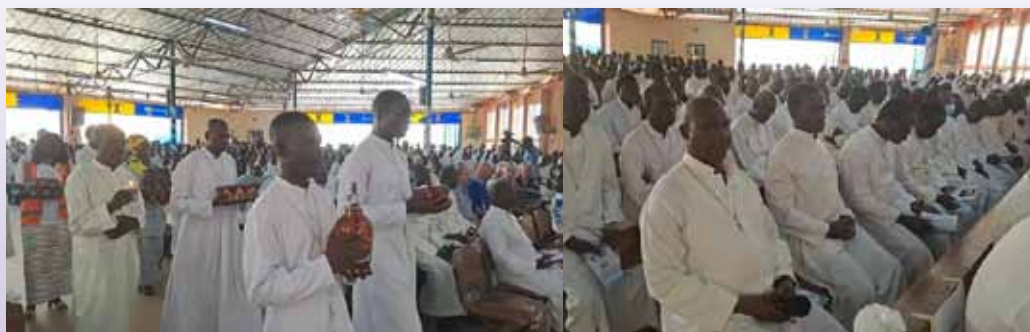
Fiesta de la Provincia Loreto - Santa Ana en Saaba (Burkina Faso)