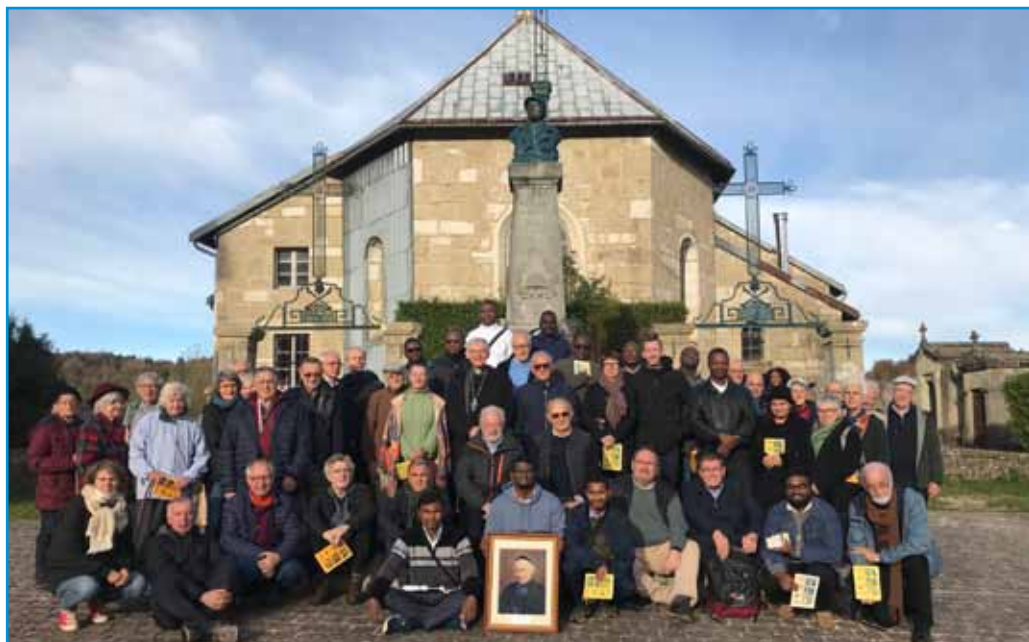
Foto del grupo de Peregrinos delante de la iglesia de Les Bouchoux

segundo momento, junto con los peregrinos, y después algunos se trasladaron también a oír misa a la catedral de Saint-Claude.