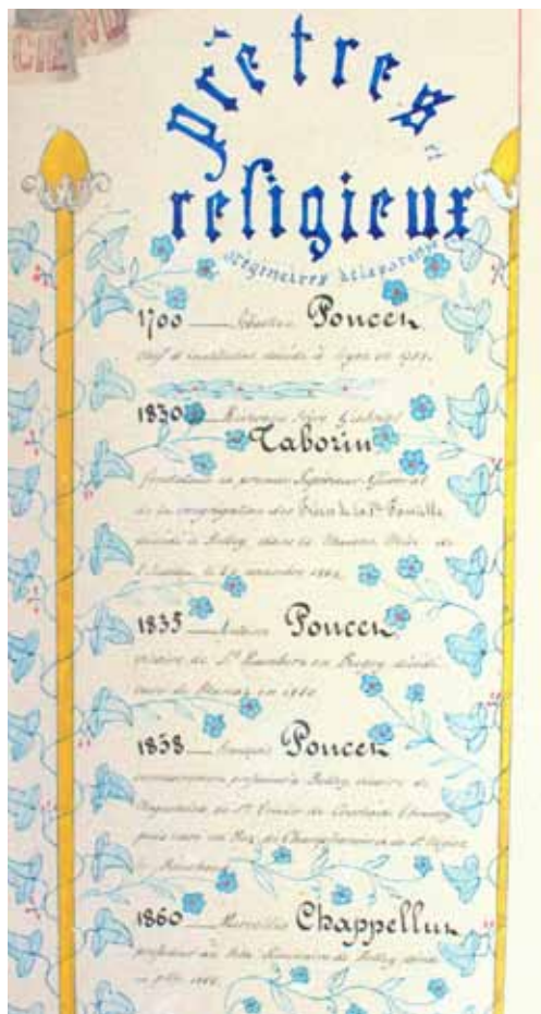
Cuadro donde se cita la visita del H. Gabriel. Casa parroquial de Belleydoux

En una de las visitas, al ver la iglesia abierta, me dijeron que si podían entrar. Por supuesto, les dije que sí. Iban los abuelos, los padres y