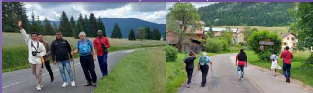
Marcha de Belleydoux a Les Bouchoux