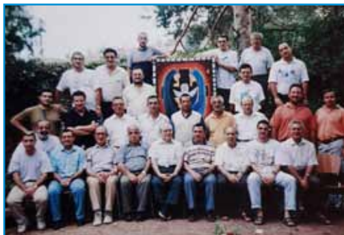
Ejercicios E. en Valladolid