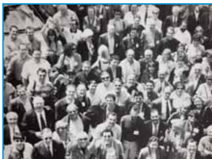
Foto de los congresistas en St. Anthelme