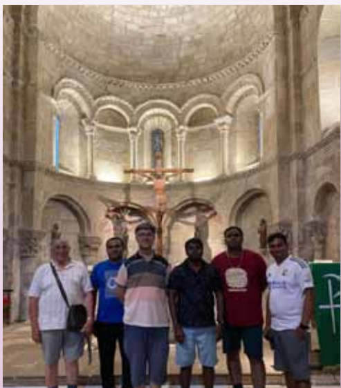
Hermanos visitando la colegiata románica de Elines, Cantabria