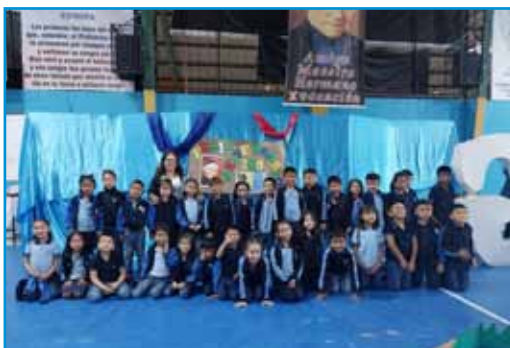
Fiesta del Fundador en Puyo