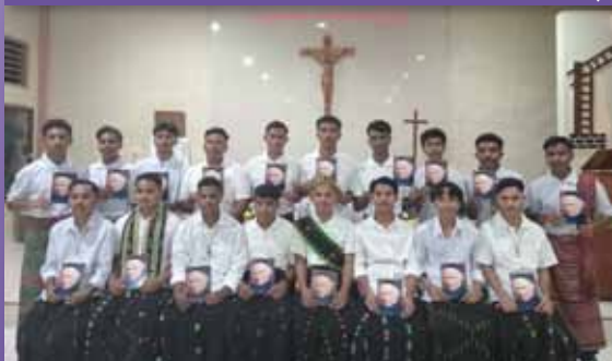
Postulantes en Nita (Indonesia)