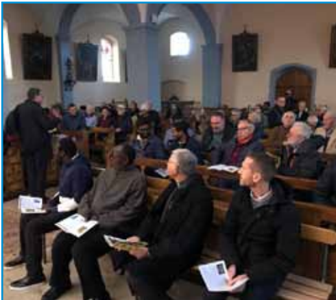
Momento de la peregrinación en el interior de la iglesia de Les Bouchoux

Quiero destacar el encuentro que tuvimos con un grupo bastante numeroso, durante la celebración del Bicentenario. Llegamos a la iglesia después de superar ciertas dificultades de tráfico, pues se avisaba que la carretera estaba cortada. Afortunadamente logramos llegar. En la iglesia, todo estaba preparado: calefacción, micrófono. Compartimos la celebración, dialogamos, les entregamos el cuadernillo donde se expresa lo que tuvo lugar en Les Bouchoux. Terminamos haciéndonos una foto todos juntos.