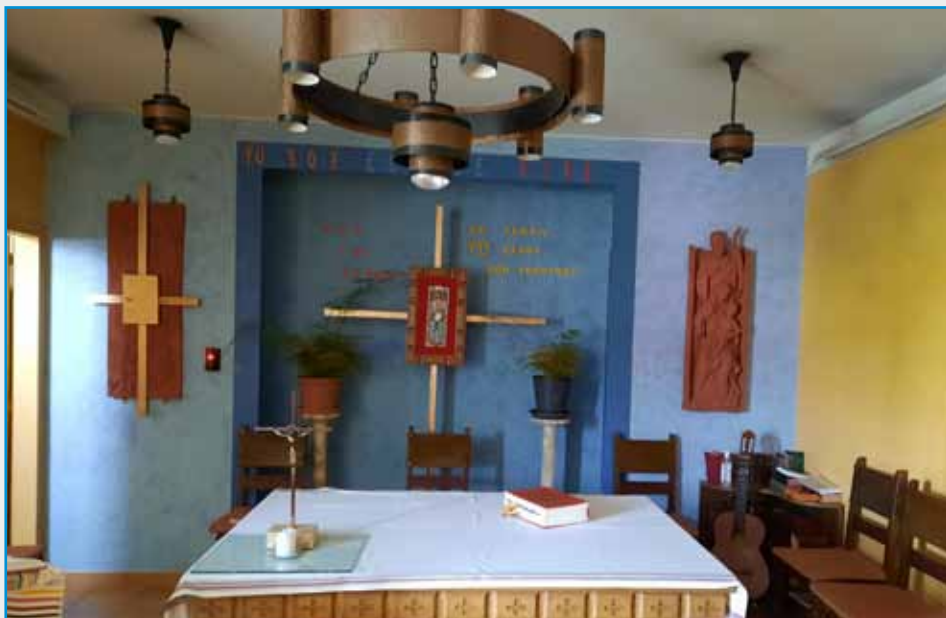
Capilla de la comunidad de los Hermanos del Colegio Sagrada Familia – Horta

algunas líneas diagonales, como los pliegues del manto de María y la figura del Niño, y con la diagonal opuesta de los brazos del Niño. El movimiento de Jesús lo convierte en el centro de atención, frente al estatismo de los padres, mientras que con sus brazos se hace cercano al espectador en actitud de ofrecimiento.