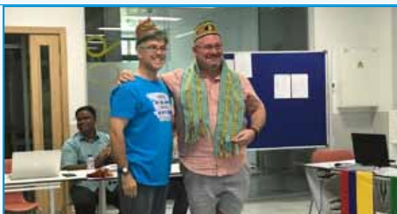
H. Nacho y H. Provincial con atuendo indonesio

de expresar sus ideas, de que experimenten y puedan comprometerse como "elegidos"? Y respecto a los mismos de siempre elegidos, ¿porque valen? Y si son los que valen, ¿por qué las buenas ideas de los capítulos no cambian la realidad provincial y ellos no son motores de cambio?