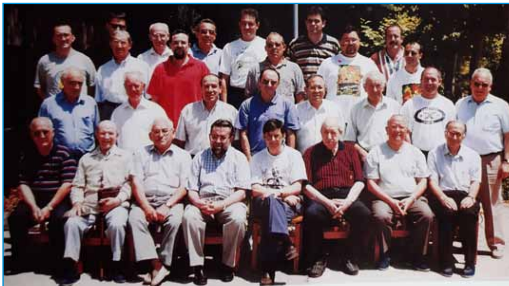
Ejercicios E. en Sigüenza

Los Ejercicios espirituales de 1999, tenían este año dos motivos muy particulares: la celebración del Bicentenario del Nacimiento del V. H. Gabriel y la preparación inmediata par Jubileo del año 2000