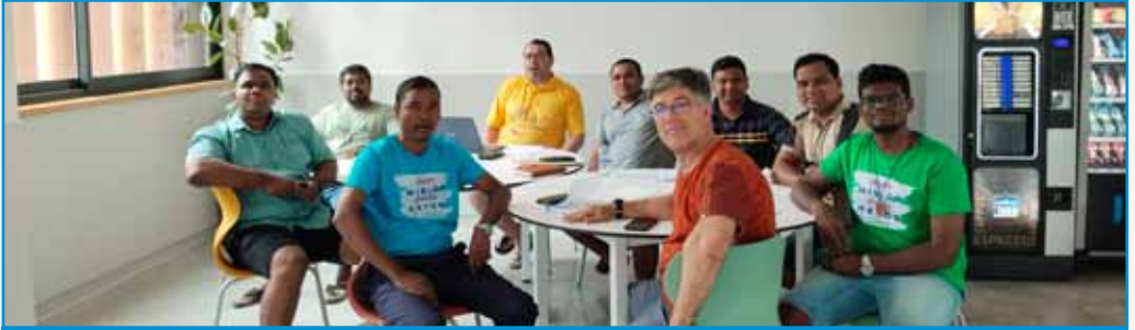
Hermanos asistentes al Capítulo del Sector India

The remaining challenge has to do with the ability of each one to 'tune in' to the spirit of the Chapter, with the desire to find the means to animate the life of our Province and with the need to seek ways of renewal in all areas of our religious life. No matter how much the reports presented spoke to us of more familiar realities in our communities or in our works and delegations, no matter how much we heard the impassioned plea of the need for change, the real challenge remains each Brother in his community and with his mission, with his community reality and in his personal situation.