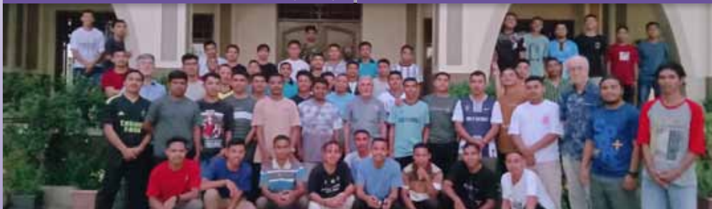
HH. Escolásticos en Kupang - Indonesia