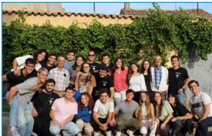
Días de reflexión y oración de la comunidad juvenil de 4º de carrera de Madrid, en La Horra

Los miembros de la Familia Sa-Fa están llamados hoy a una tarea de discernimiento para, de forma personal o participando en las diversas instancias de diálogo, de deliberación y de decisión (reuniones, asambleas, Consejos, Capítulos), mantener los aspectos esenciales del carisma recibido y aprovechar las oportunidades de crecimiento humano y espiritual que presentan las diversas situaciones y tendencias del mundo actual.