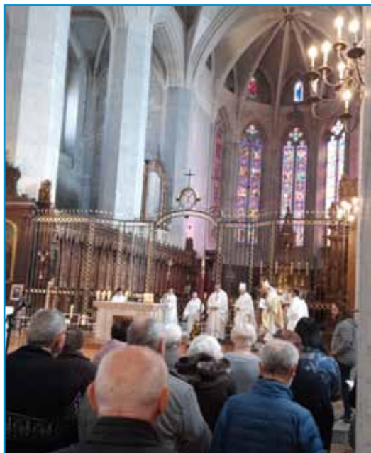
Misa en la Catedral de Saint-Claude