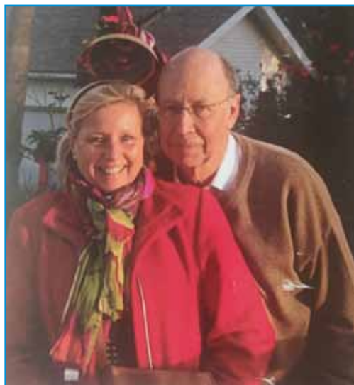
Matrimonio Sitt. Castillo Hostel