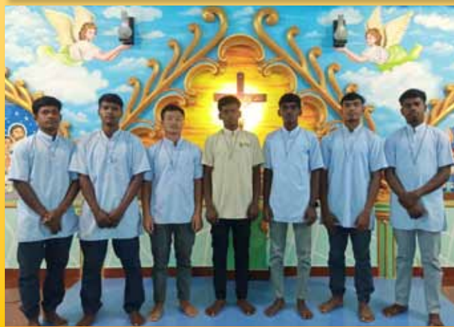
Postulantes y novicio en Eluru