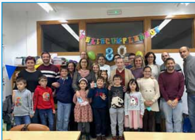
Celebrando su 80 aniversario con la comunidad “Los Locos”

Le conocimos allá por 1997, cuando teníamos 18 años y un exceso de celo en lo relativo a formar comunidad. Recordamos bien sus medias sonrisas sentado entre 30 chavales intentando aprenderse nuestros nombres y nuestra sorpresa de que quisiera seguir viniendo cada sábado a estar con nosotros.