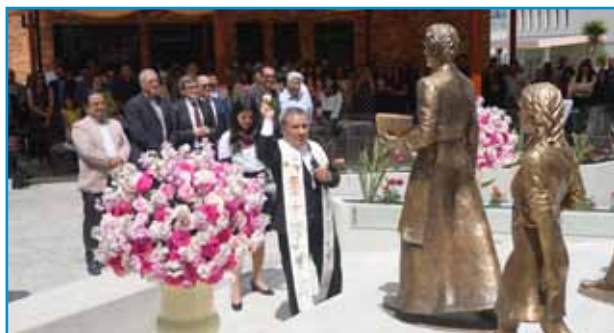
Bendición del grupo escultórico