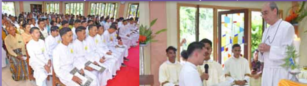
Primera Profesión en Nita (Indonesia)