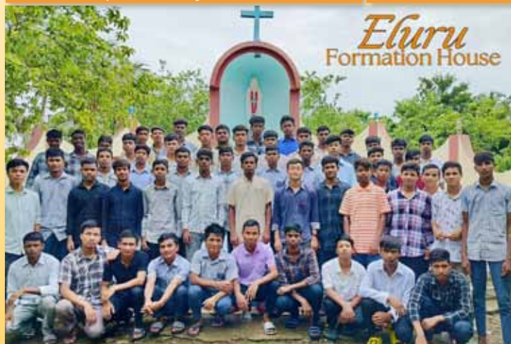
Aspirantes, postulantes y novicios en Eluru (India)