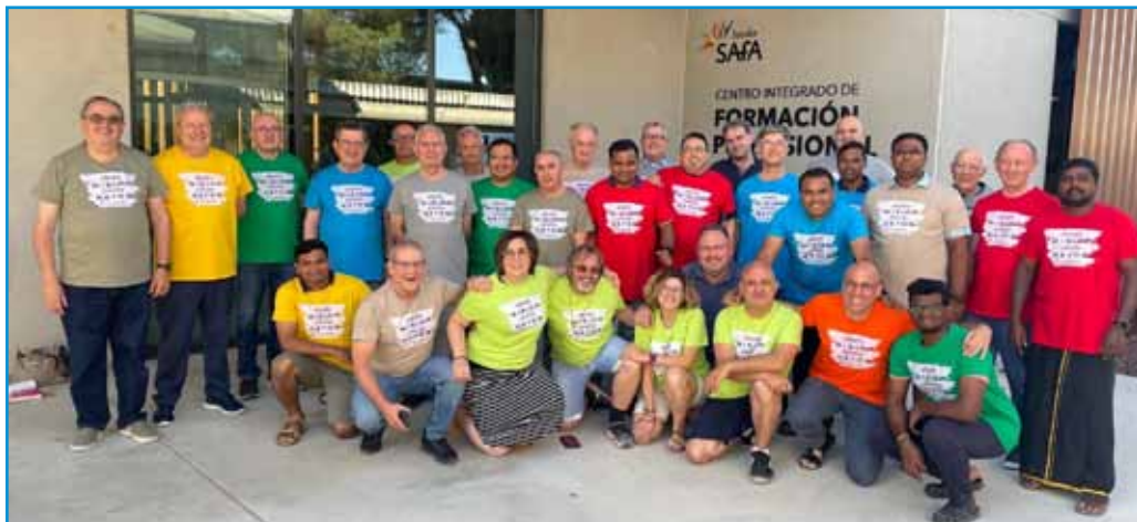
Hermanos y Laicos, participantes en la Asamblea Capitular

E ntre los días 14 y 22 de julio de 2024, en los locales del nuevo centro de Formación Profesional, en la casa de los Hermanos de la Sagrada Familia de Valladolid, se celebró el XIX Capítulo Provincial, bajo el lema: "Misma misión, nuevos retos".