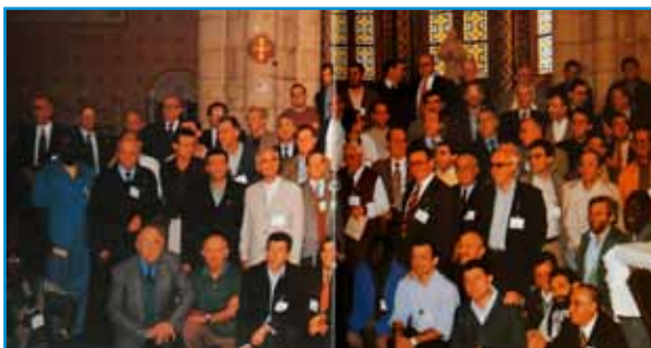
Momento de visita a la tumba del V. H. Gabriel