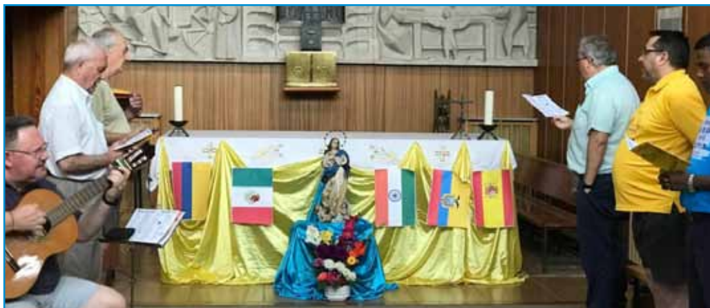
Momento de Oración

necesidad de buscar caminos de renovación en todos los ámbitos de nuestra vida religiosa. Por mucho que los informes presentados nos hablan de realidades más conocidas en nuestras comunidades o en nuestras obras y delegaciones, por mucho que escucháramos la arenga apasionada de la necesidad de cambios, el verdadero desafío sigue siendo cada Hermano en su comunidad y con su misión, con su realidad comunitaria y en su situación personal.