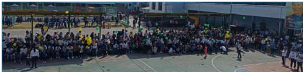
Celebración en la U.E. Verbo Divino de Guaranda

Unas 150 personas estuvieron presentes. Además de todos los Hermanos y formandos de Ecuador asistieron a la fiesta representantes de los equipos directivos, de padres de familia y alumnos de las tres unidades educativas de Ecuador. También participaron algunas de las personas que ayudaron a los Hermanos en los inicios de la fundación de la comunidad y obra educativa de Ambato que este año cumplía 15 años. Muchos miembros de las cuatro Fraternidades Nazarenas de Ecuador también participaron de la celebración.