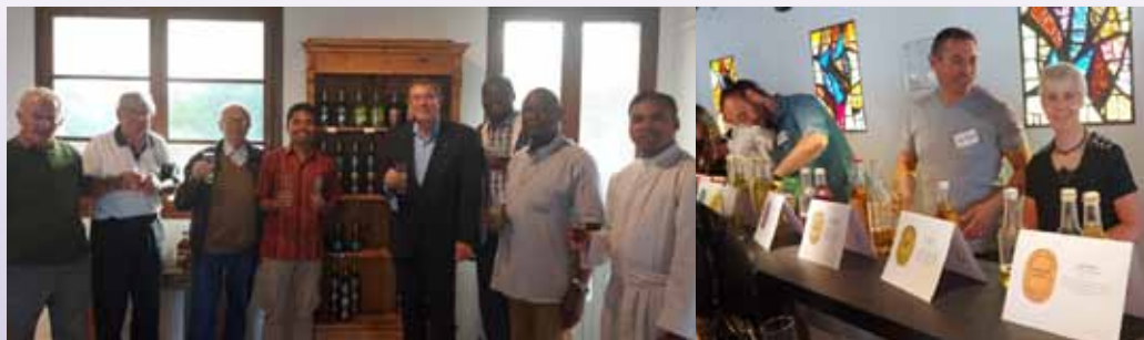
Presentación de la Sociedad Nuevo Kario