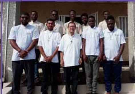
Novícios y Postulantes de Huambo (Angola)