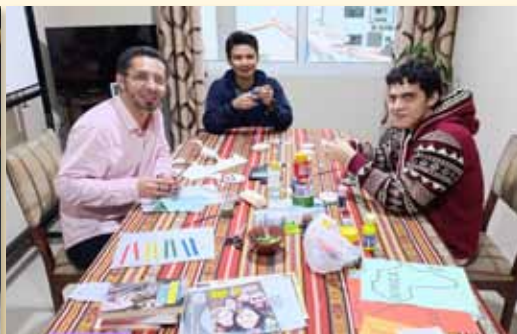
Novicios en Quito