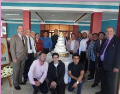
Hermanos de Ecuador y Colombia celebrando la Fiesta del Fundador en Ambato