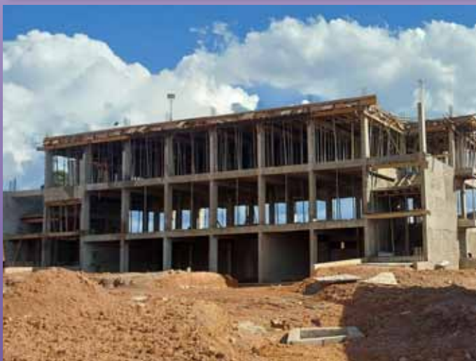
Estado de las obras de la nueva casa de formación de Huambo