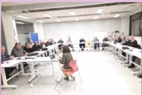
Jornada de formación sobre inteligencia emocional en Valladolid y en Gavà