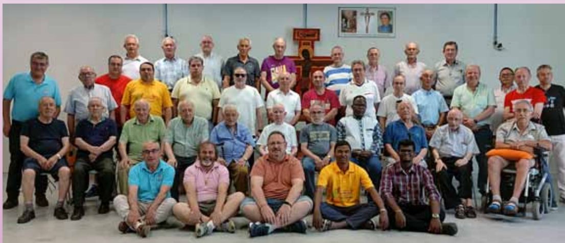
Ejercicios espirituales en Valladolid