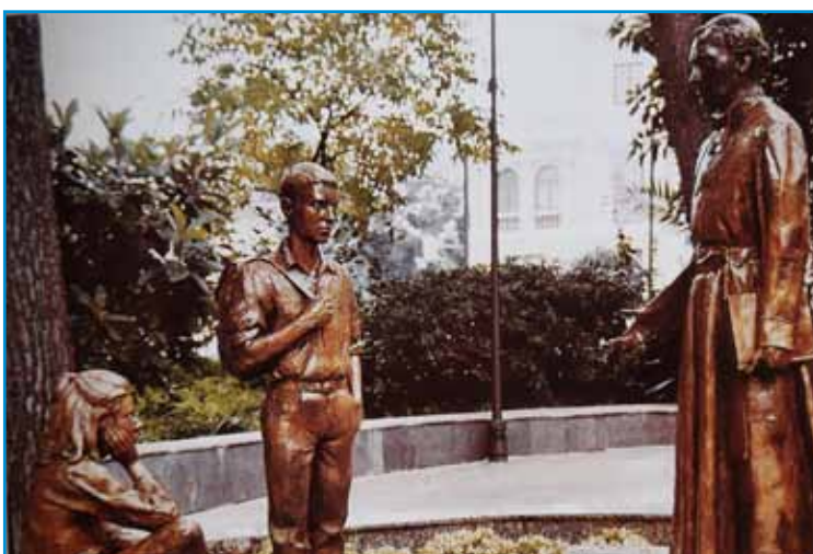
Grupo escultórico del Fundador con niños, por el escultor D. Jorge Egea