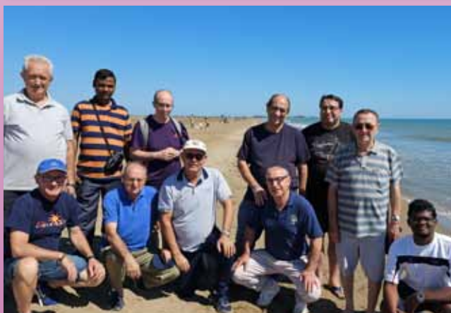
Hermanos de Barcelona y Gavà de paseo por el Delta del Ebro