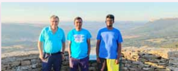
Hermanos de la India en el Mirador de La Lora