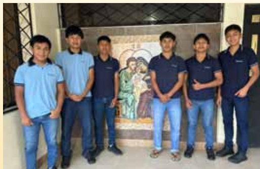
Aspirantes de Puyo (Ecuador)