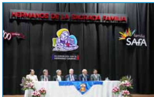
Mesa de presidencia en el acto institucional en el teatro del colegio