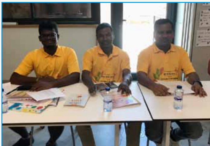
Hermanos de la India invitados como informadores

Looking, therefore, at the challenges that emerged from the last Chapter, I think it is easy to realise that the remaining challenge could not be written down. And it was not written down because it is more of an itinerary than a goal and is more personal than provincial.