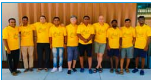
Hermanos de la Delegación de la India

Día 20, sábado.- Este fue el día de las asambleas de primera instancia, donde un miembro de cada comisión presenta los textos propuestos, reelaborados después de recoger las aportaciones hechas en la asamblea libre. Después de un turno de aclaraciones, se termina con una vo-