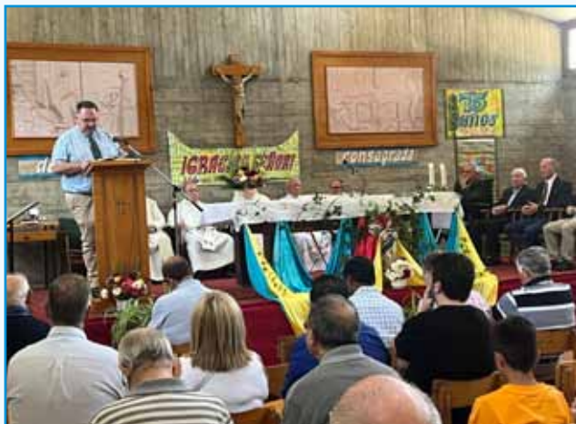
Palabras de bienvenida del H. Provincial

Este año nos reunimos una vez más, antes de comenzar el nuevo curso, para dar el impulso inicial a la tarea que tendremos por delante en 2024-2025. Es siempre un momento de satisfacción el encuentro con los Hermanos de otras comunidades y el poder compartir con ellos y con sus familiares y amigos unas horas de celebración y experiencias. En esta ocasión el principal motivo del encuentro era agradecer a Dios por los Hermanos que en este día celebraban sus Bodas de Oro y Diamante.