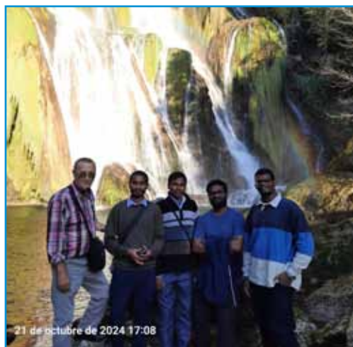
En la cascada Glandieu

Salimos en dos vehículos desde Belley para llegar con tiempo a la misa del Peregrino. Antes de entrar en el pueblo, nos dirigimos al monumento del Encuentro y desde allí fuimos al Santuario para participar en la misa que se celebra todos los días a las 11h. Acabada la misa oramos ante el sepulcro del santo cura y a continuación, guiados por el H. Teodoro,