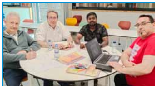
Grupo de trabajo