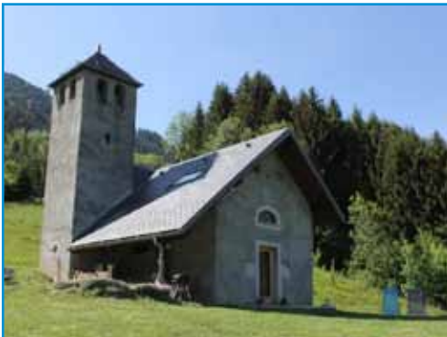
Ermita de la granja de Malapalud