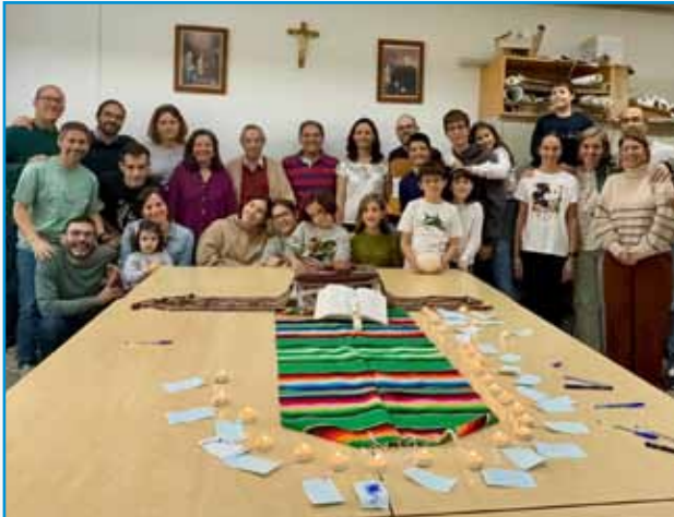
Reunión de formación y oración con la comunidad "Los Locos"

adorar y alabar a Dios, pidiendo su canción favorita de vez en cuando... Ahí se dejaba llevar cerrando los ojos y conectando con su raíz.