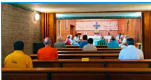
Momento de oración