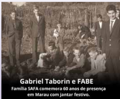
6o aniversário de la Família Sa-Fa en Marau (Brasil)