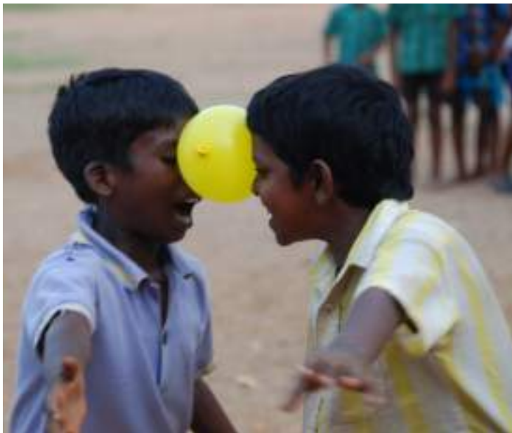
St. Peter & St. Paul Elementary School, India

Ecuador Colombia India Burkina Fasso Indonesia.