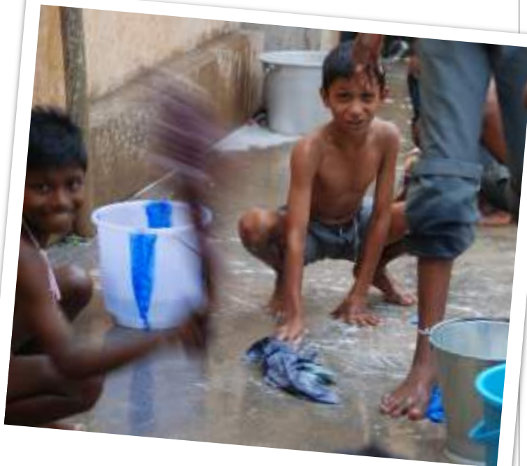
Andhra Pradesh, India.

Según Naciones Unidas, en el enunciado del ODS nº. 4 “Educación de Calidad”, alrededor de 260 millones de niños, aún estaban fuera de la Escuela en 2018 . Esto significa que el 20% de la población mundial, dentro de la franja de edad escolar , no hace algo tan “normal” para nosotros, como es ir al colegio cada día.